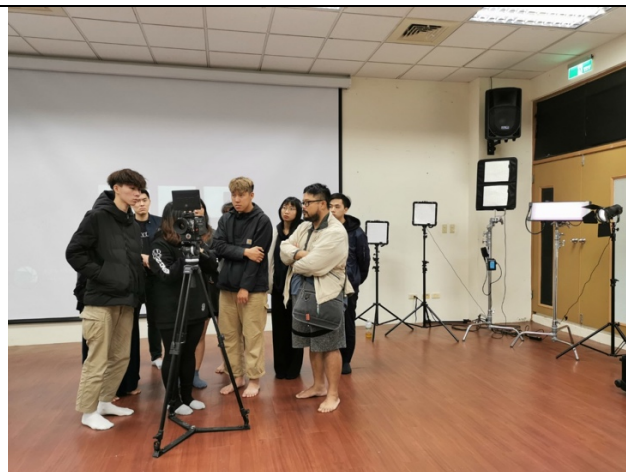
RED 電影攝影機工作坊，介紹電影級燈光設備