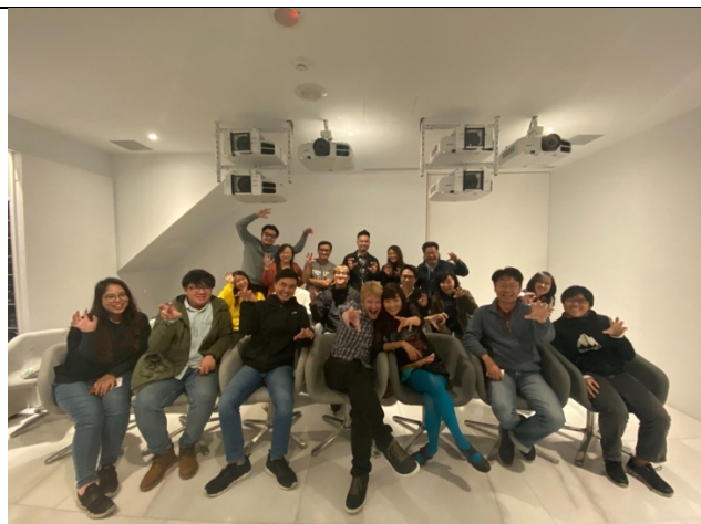
電影視覺特效創作分享會與會人員合影