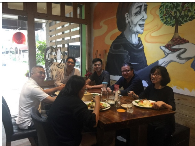
視覺藝術課程社群成員分享教學經驗