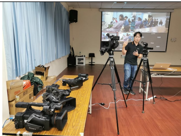
Sony 電影攝影機工作坊，介紹最新攝影機種