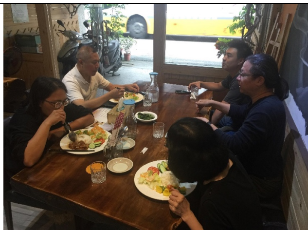
社群成員討論未來社群之活動安排