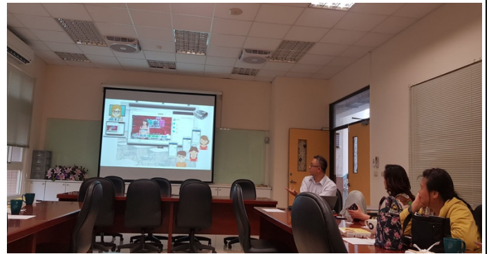
周總經理介紹博課師平台的功能