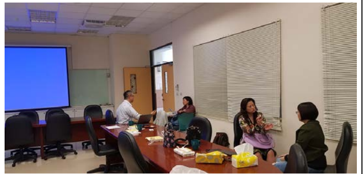
社群成員討論分享心得