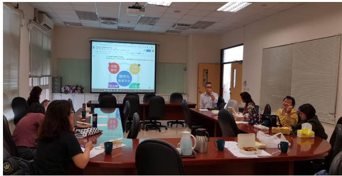
周總經理向社群成員介紹博課師平台