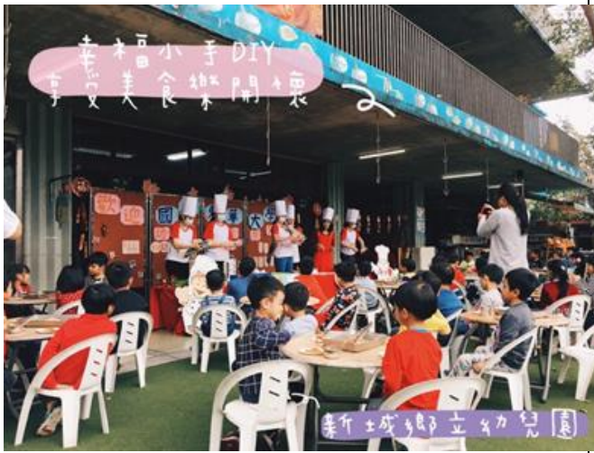
教師示範製作披薩