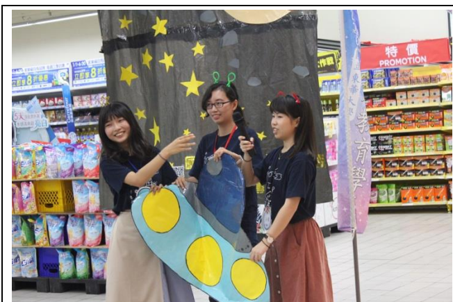
透過開恥戲劇讓幼兒能馬上進入情境中！