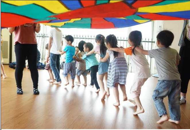
連續 4 場都有的氣球傘活動，小朋友都玩得不亦樂乎！