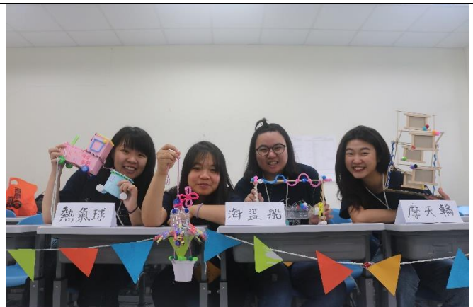
4/21 最後一場活動，我們的循環樂園完成了