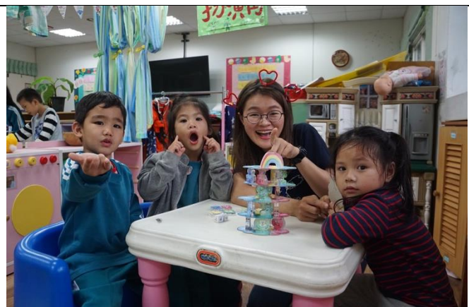
大家合力一起幫助怪獸們成功找到魔法彩虹，小朋友們都玩得很盡興！