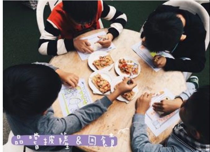
活動最後幼兒填寫回饋單，畫出無限創意