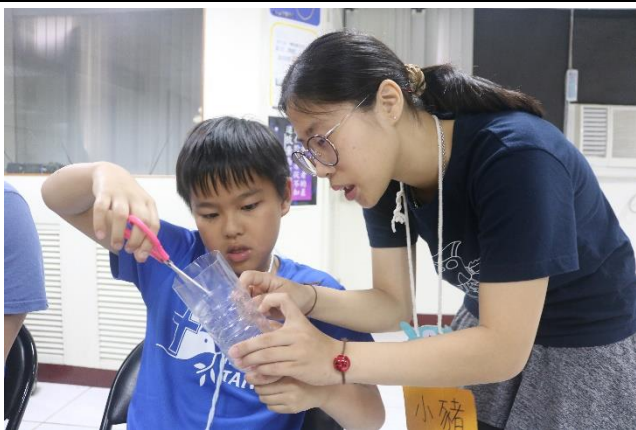
4/20 寶特瓶剪一剪，就可以做出可愛的風鈴