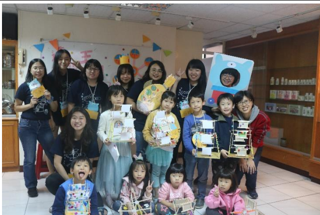
2/24 第一場舉辦的活動，和幼兒一起完成摩天輪的製作