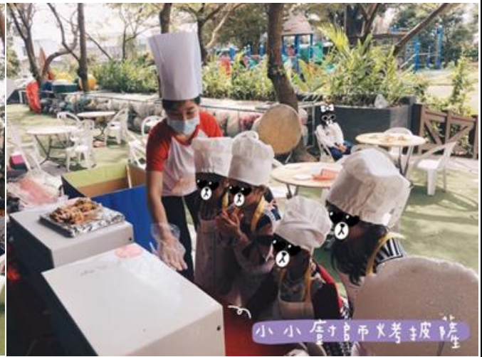
教師向幼兒解說如何使用烤箱