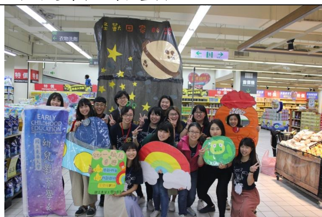
最後一場活動，圓滿落幕！謝謝所有的參與家庭！也謝謝來幫忙的同學們！