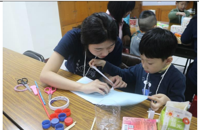
3/9 一起和姐姐們把喝完的飲料盒變身成漂亮的置物小火車