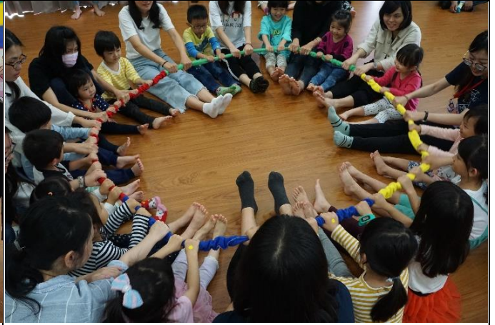
用鬆緊帶玩小遊戲，小朋友及大人都玩得很盡興！