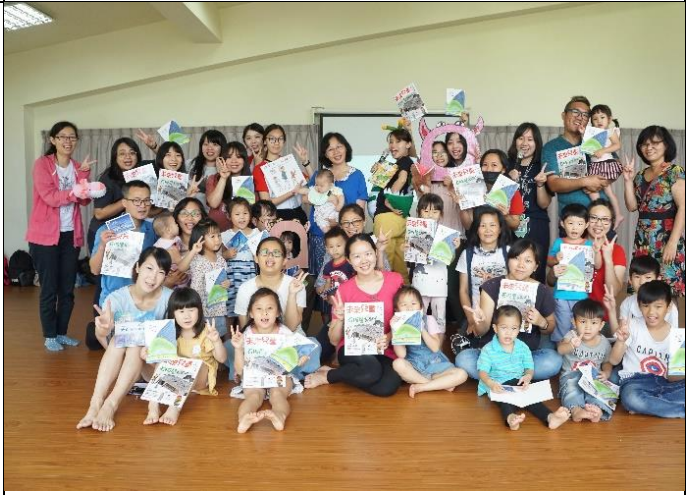
最後一場活動，圓滿落幕！謝謝所有的參與家庭！