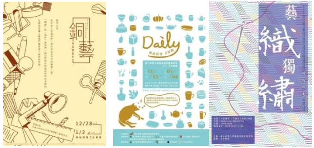
總展邀請卡與部分工坊展海報