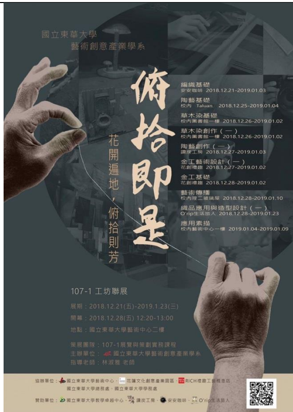
「俯拾即是」總展策展文