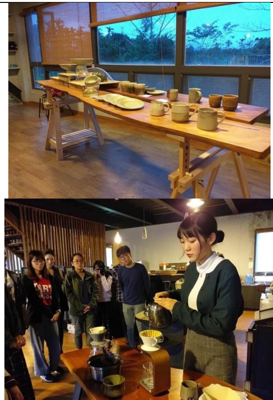
陶工坊展於讚炭工場舉辦，並辦理手沖咖啡體驗活動