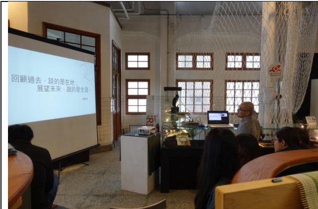
3. 期末學習總成果 PPT 發表，文創空間多元使用，優秀作品可成為空間櫥窗裡的座上賓。