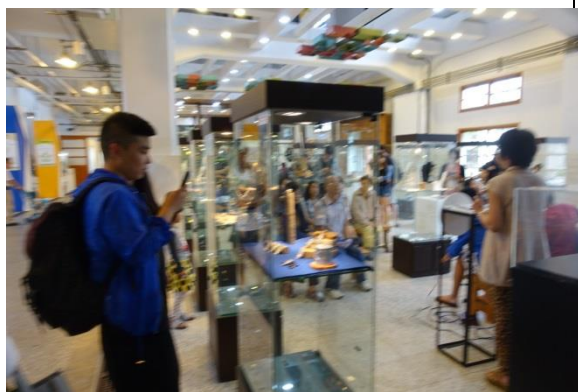
2. 學生導覽創作作品