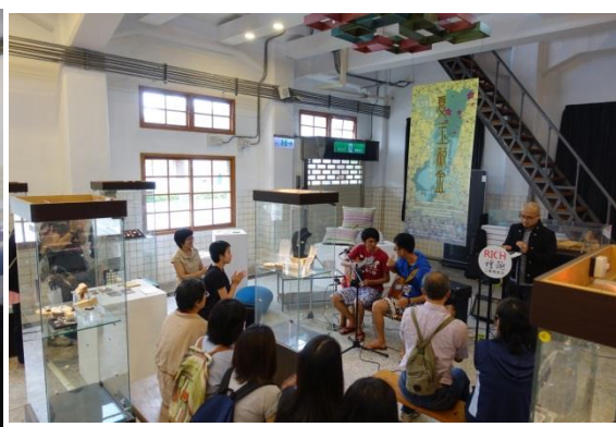
3. 對岸來的觀光客給與創作者最實質的鼓勵，收藏作品