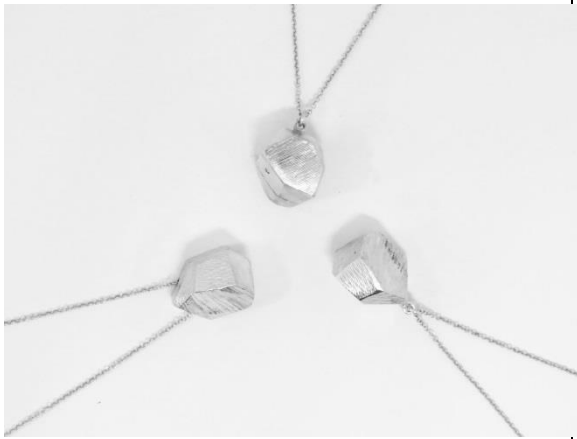
7.以“海的味道”結合礦石結晶所開發的銀墜飾。