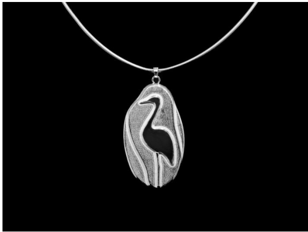
6.以“好山好水出好米”所開發的形象銀飾品。