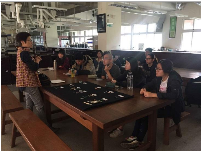
1.授課與討論練習成果，學生聚精會神。