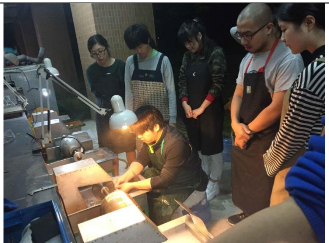
2.外聘業師教導玉石研磨研習，為量產開發建立基礎能力。