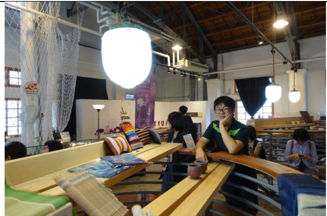
4. 花蓮文創園區《RICH-禮趣工藝概念店》是產學空間，學生自主管理經營，在此可一窺花東工藝的濃縮精煉版。