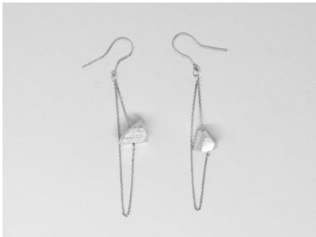
8.以“海的味道”結合礦石結晶所開發的銀耳飾。