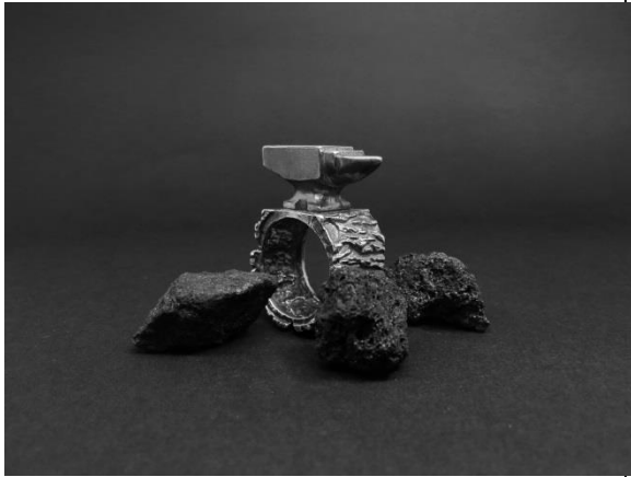
5.傳遞工藝精神的鐵鑿銀飾，可成為量產開發商品。