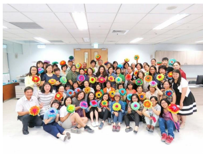
活動參與學員合照