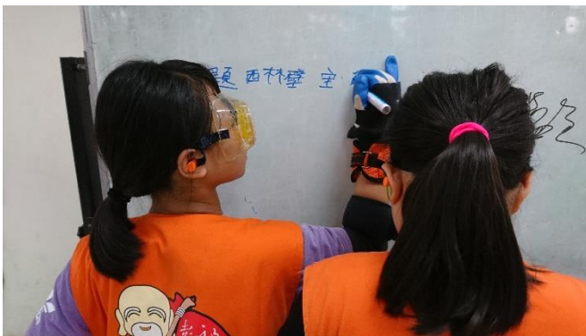
挑戰用老化的身體寫字