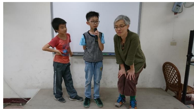
學生分享體驗後心得