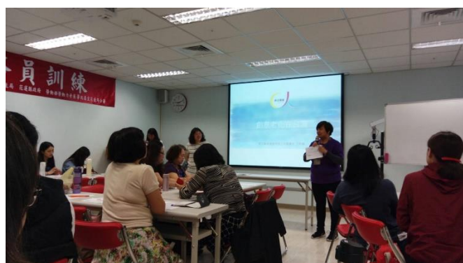
講師分享傳承藝術工作經驗