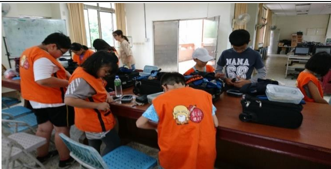
小朋友穿戴體驗包