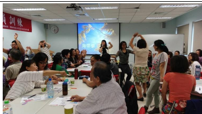
學習團體活動設計及帶領技巧