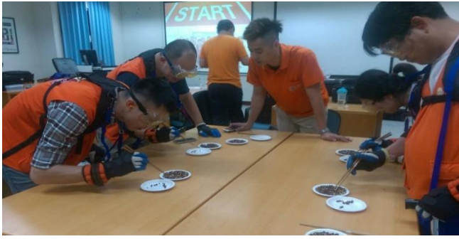
手到擒來：挑戰夾豆子