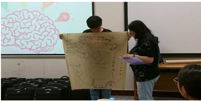
參加者討論並分享環境是否友善