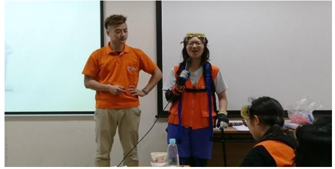
參與者分享體驗感受