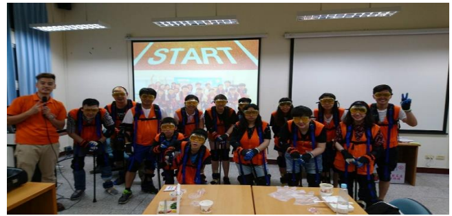
穿上體驗包大合照