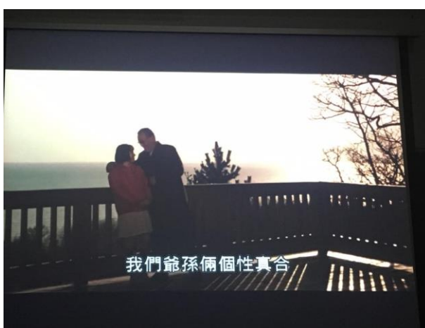
3/23 影展首場跟著春天去旅行