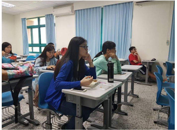
台下的小組員們也用心地聆聽並提出回應