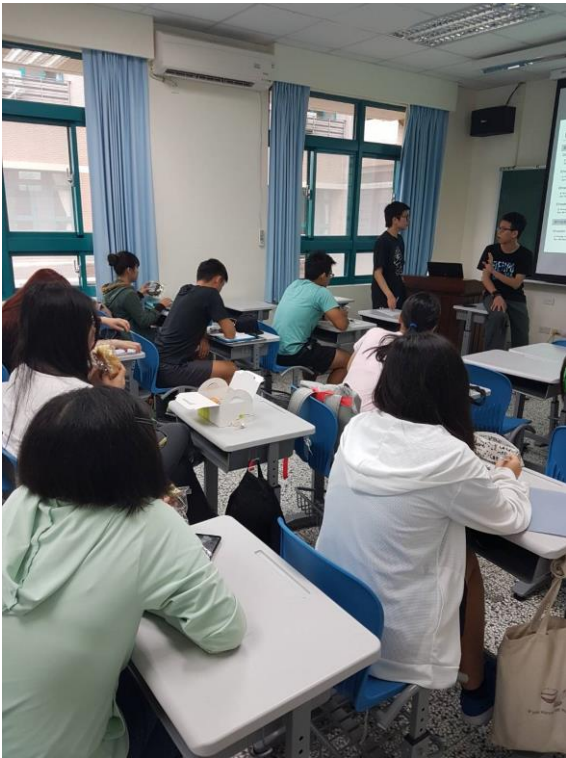
各組的小組長分別上台報告目前進度