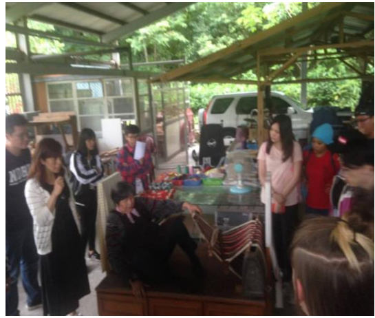
帶加拿大渥太華師生到銅門/Dowmung 部落導覽並體驗人文觀光之旅