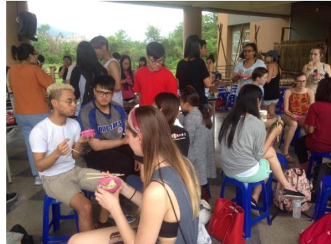
實際用英語介紹傳統食物給加拿大渥太華/University of Ottawa 師生