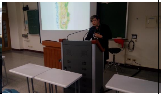
東冬·侯溫老師介紹銅門部落