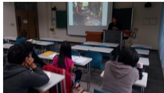
東冬·侯溫的部落介紹講座