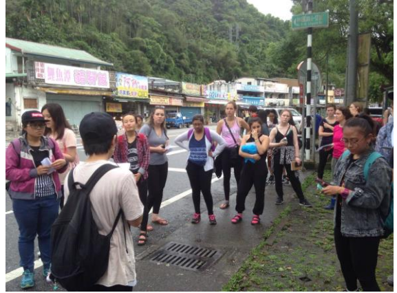
帶加拿大渥太華師生到鯉魚潭導覽並體驗人文觀光之旅