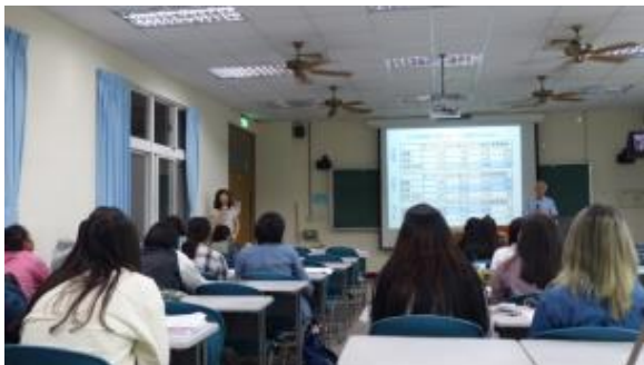
本計畫主持人進行同步翻譯