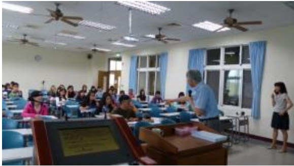
生越直樹教授跟同學互動